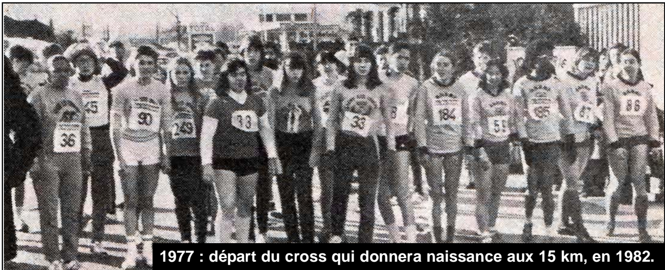
1977 : départ du cross qui donnera naissance aux 15 km, en 1982.