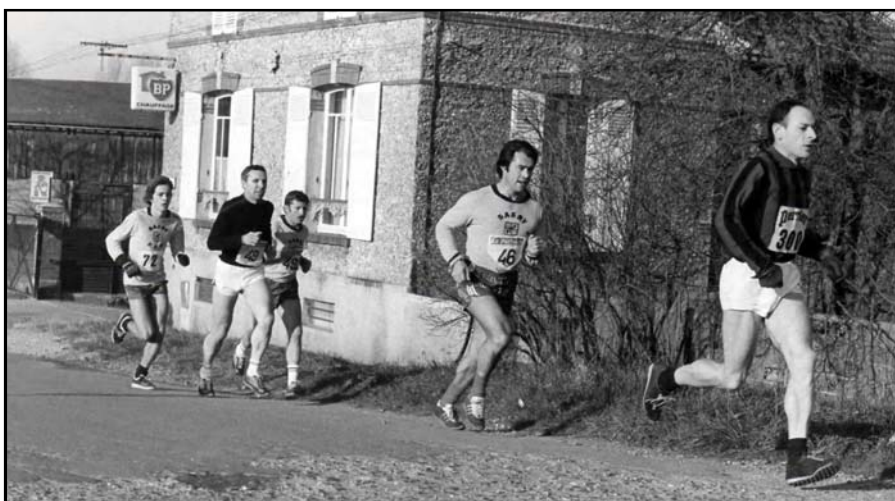
Les coureurs en plein effort. Le départ vient d'être donné.

En 1979, la semaine commerciale et sportive d'Esby est programmée à la mi-avril. L'épreuve a lieu le matin, on dénombre 125 coureurs représentant les clubs de Meaux, Lagny, Boissy-le-Châtel, Saint-Pathus... «Le