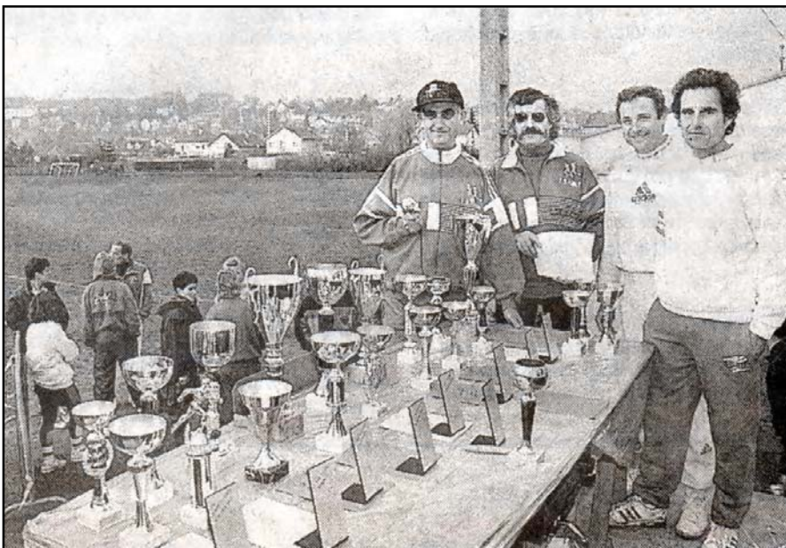
1993 : Esbly n'a pas encore de salle, tout se prépare dehors, par tous les temps !