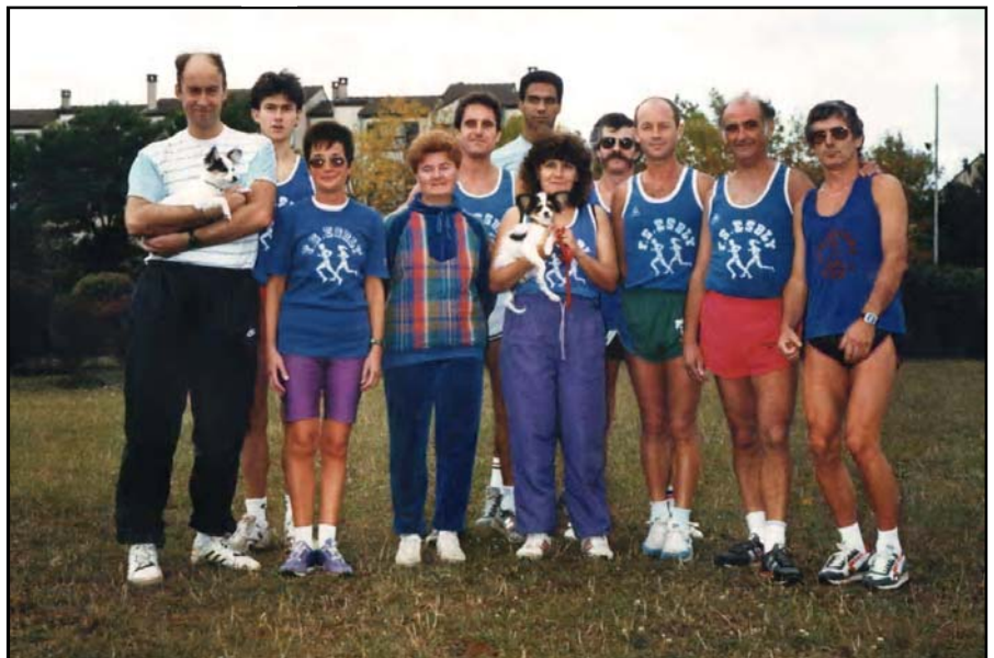
Les coureurs de la FSECA s'entraînent sur le stade tous les dimanches matin. Photo prise dans les années 1990.

Les 300 coureurs sont protégés et guidés aux carrefours par plus de 60 signaleurs bénévoles, tandis que la Protection Civile assurent la sécurité sanitaire. Un médecin est présent.