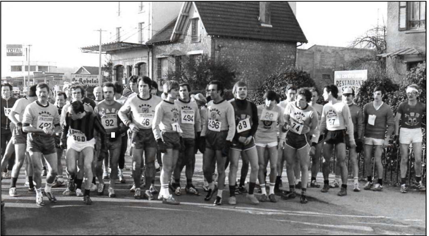
Avril 1979 : les coureurs sont sur la ligne de départ.