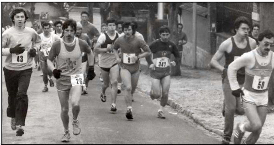
Petite mise en jambes : les coureurs attaquent la côte de la rue de la République, 3,3 % sur 1,6 km.