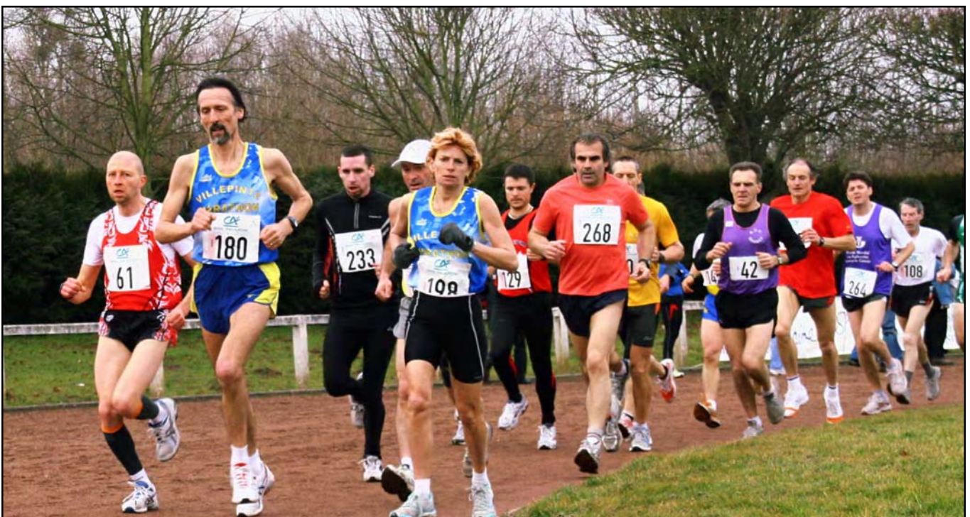
Les 15 km d'aujourd'hui. Le départ est donné au stade et l'arrivée a lieu le long de l'espace Jean-Jacques Litzler.